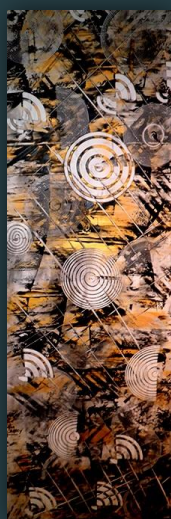
LivingFurrow Acrylique 50x150 2015

CYLEX: Comment peut-on organiser une visite pour vous voir travailler?